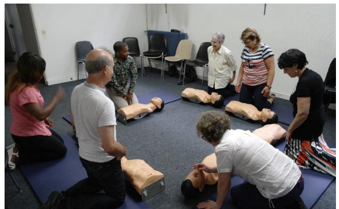
L'apprentissage du massage cardiaque lors d'une formation